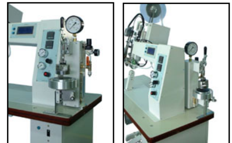
例：クインライト製テーピング機（QHP-A05）のテーブルに セットした場合