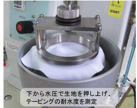
下から水圧で生地を押し上げ、 テーピングの耐水度を測定